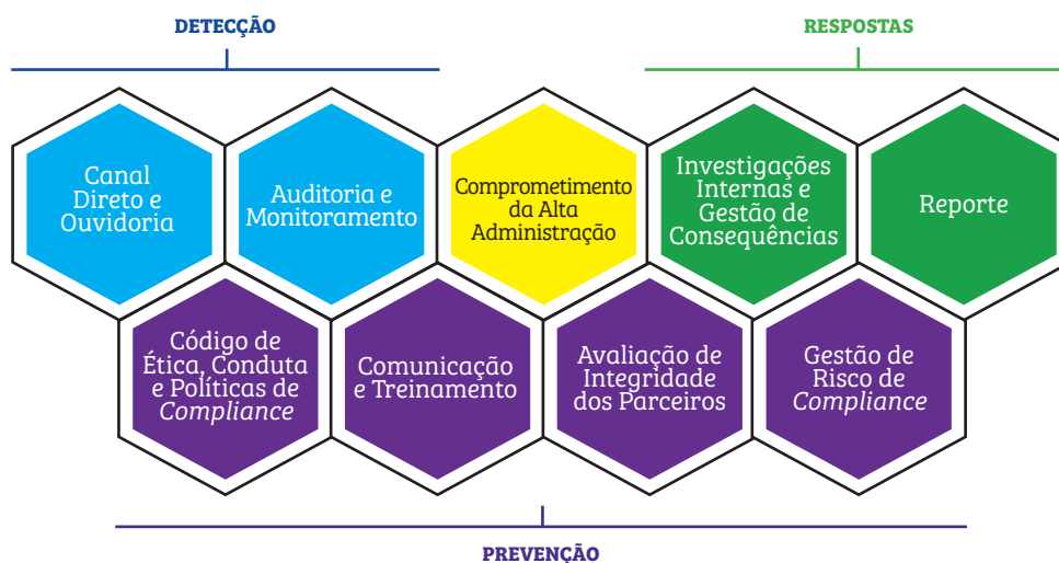
Figura 2: Pilares do Programa de Integridade

A Gerência de Compliance , dotada de autonomia, independência, imparcialidade, recursos materiais, humanos e financeiros para o pleno funcionamento, é a área responsável pelo Programa de Integridade.